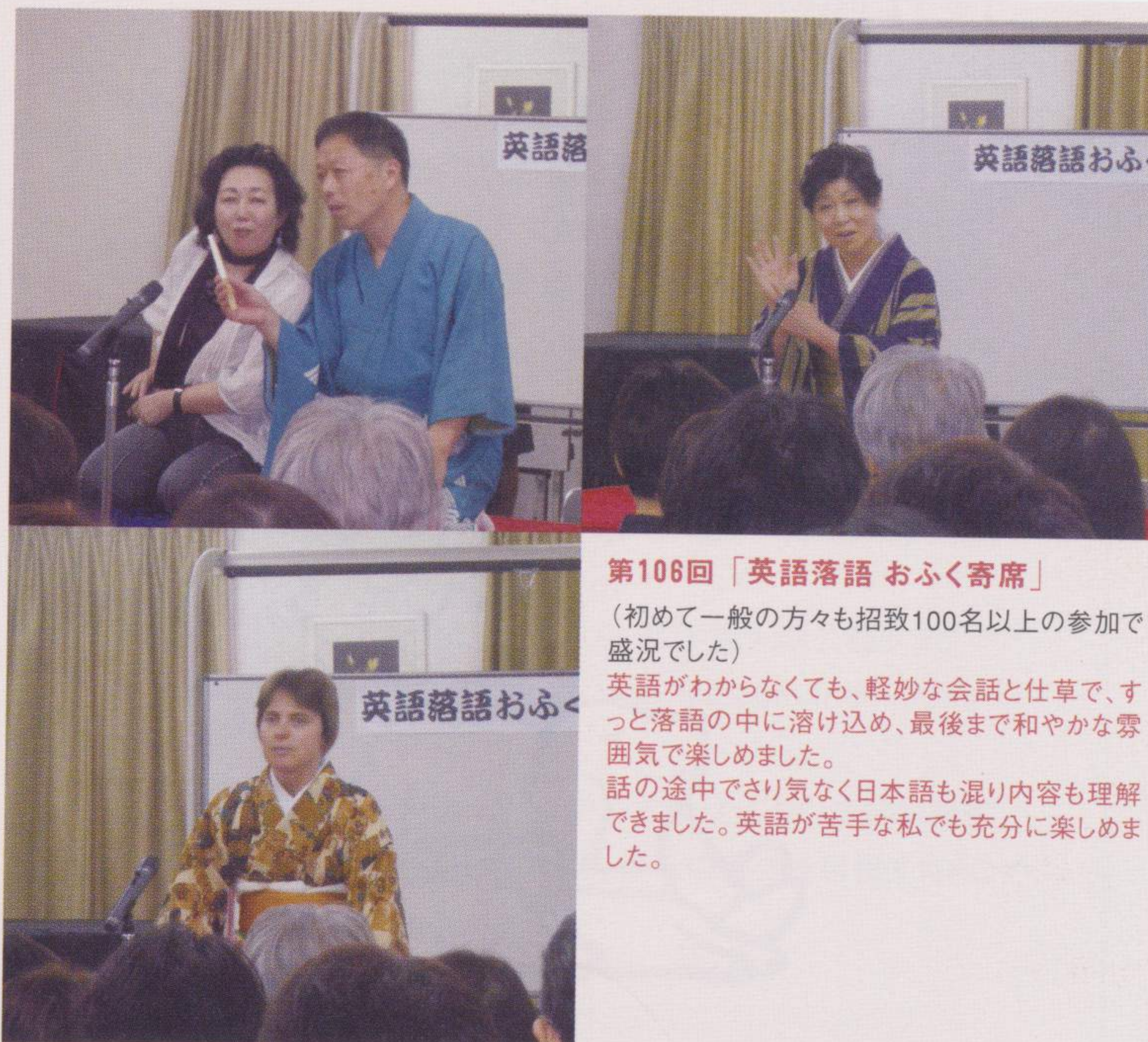
第106回「英語落語 おふく寄席」 (初めて一般の方々も招致100名以上の参加で盛況でした) 英語がわからなくても、軽妙な会話と仕草で、ずっと落語の中に溶け込め、最後まで和やかな雰囲気を楽しめました。 話の途中でさり気なく日本語も混り内容も理解できました。英語が苦手な私でも充分に楽しめました。