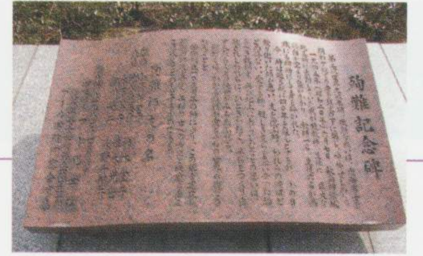
動員学徒殉難記念碑