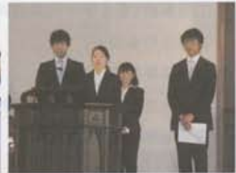
大学同窓会ミツバ会報告