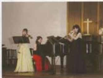
高117回生 ミニコンサート