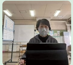
日本語教室での遠隔授業風景

留学生とは違い、子どもたちは親に連れてこられ、言葉が全く通じない学校で孤立してしまうことがあります。そのような子ども達が、センター校に集まり、一緒に勉強し、元気よく遊んでいる姿を見ることに働き甲斐を感じています。また、堺市の小中学校に所属している全ての外国に繋がる児童生徒の日本語力を把握して、一人ひとりの支援シートを作るのもセンター校の仕事です。プール学院大学院で学んだ、異文化理解や多様な価値観や視点を持つことの大切さが、今の仕事にとっても役に立っています。プール学院大学院で勉強ができて本当に良かったと感謝の気持ちでいっぱいです。