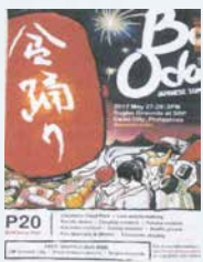
日比親善盆踊り大会のチラシ