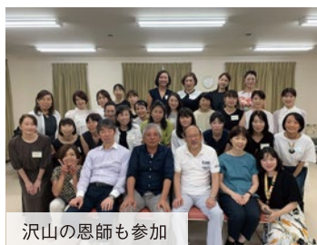
沢山の恩師も参加