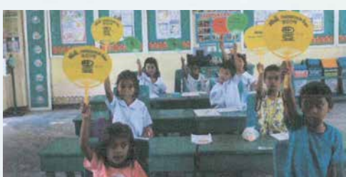
配られたうちわに大喜びの子どもたち

ご家庭で不要になったうちわを現地へ送る活動は今後も接続 していきます。ご協力よろしくお願いします。