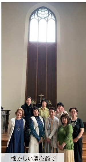
懐かしい清心館で