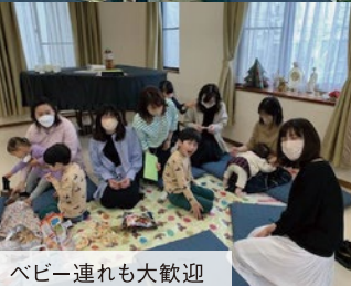
ベビー連れも大歓迎