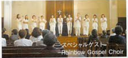
スペシャルゲスト Rainbow Gospel Choir